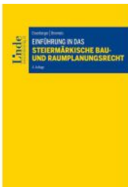
Einführung in das Steiermärkische Bau- und Raumplanungsrecht Ladenpreis: 62,00EUR