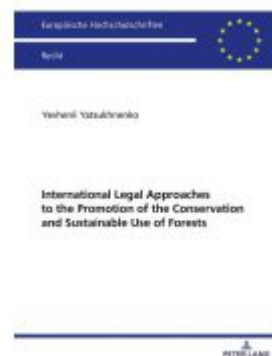
International Legal Approaches to the Promotion of the Conservation and Sustainable Use of Forests Ladenpreis: 87,30EUR