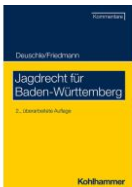
Jagdrecht für Baden-Württemberg Ladenpreis: 50,40EUR