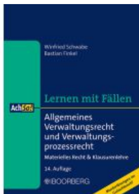
Allgemeines Verwaltungsrecht und Verwaltungsprozessrecht Ladenpreis: 23,20EUR