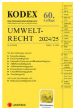
KODEX Umweltrecht 2024/25 - inkl. App Ladenpreis: 109,00EUR

Wir haben andere Produkte gefunden, die Ihnen gefallen könnten!