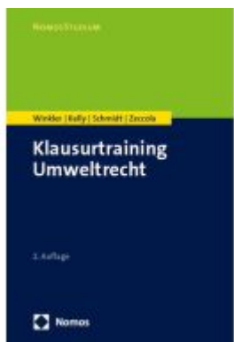
Klausurtraining Umweltrecht Ladenpreis: 29,80EUR