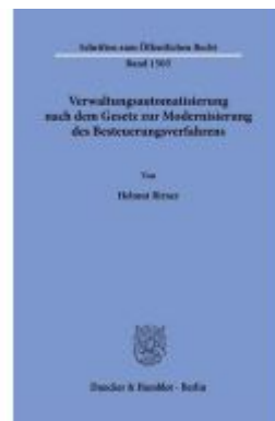
Verwaltungsautomatisierung nach dem Gesetz zur Modernisierung des Besteuerungsverfahrens. Ladenpreis: 113,00EUR