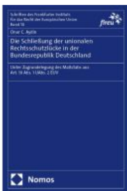
Die Schließung der unionalen Rechtsschutzlücke in der Bundesrepublik Deutschland Ladenpreis: 81,30EUR