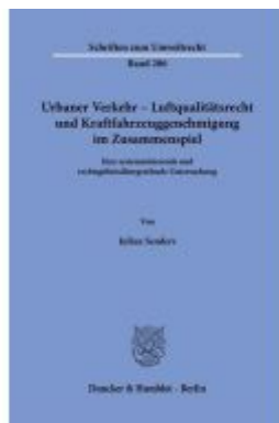
Urbane Verkehr - Luftqualitätsrecht und Kraftfahrzeuggenehmigung im Zusammenspiel. Ladenpreis: 123,30EUR