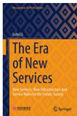
The Era of New Services Ladenpreis: 153,99EUR