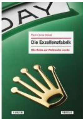
Die Exzellenzfabrik - Wie Rolex zur Weltmarke wurde Ladenpreis: 29,80EUR