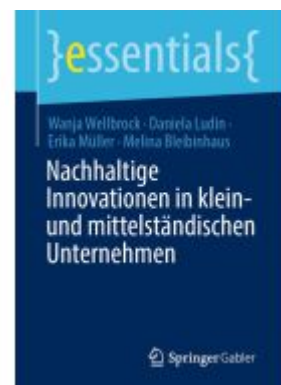
Nachhaltige Innovationen in klein- und mittelständischen Unternehmen Ladenpreis: 15,41EUR