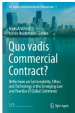
Quo vadis Commercial Contract? Ladenpreis: 197,99EUR