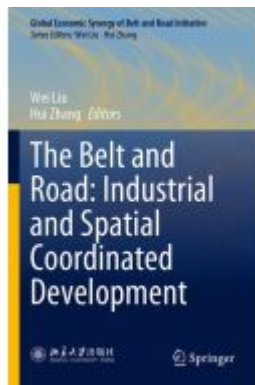
The Belt and Road: Industrial and Spatial Coordinated Development