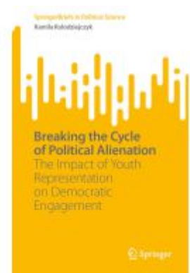
Breaking the Cycle of Political Alienation