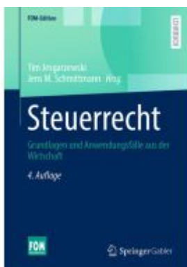
Steuerrecht Ladenpreis: 51,39EUR