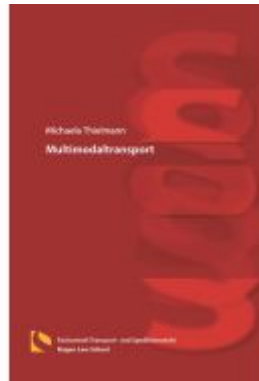
Multimodaltransport Ladenpreis: 25,70EUR