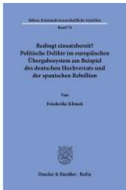
Bedingt einsatzbereit? Politische Delikte im europäischen Übergabesystem am Beispiel des deutschen Hochverrats und der spanischen Rebellion. Ladenpreis: 92,50EUR