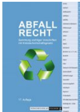
Abfallrecht 2024 Ladenpreis: 17,10EUR