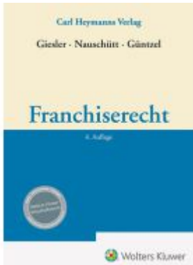
Franchiserecht Ladenpreis: 173,80EUR