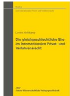
Die gleichgeschlechtliche Ehe im Internationalen Privat- und Verfahrensrecht Ladenpreis: 41,00EUR