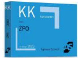
Karteikarten ZPO Ladenpreis: 14,30EUR