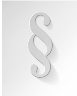
Deutsches Verfassungsrecht 1806 - 1918 Ladenpreis: 267,23EUR