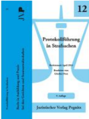
Protokollführung in Strafsachen Ladenpreis: 22,70EUR