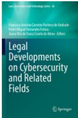
Legal Developments on Cybersecurity and Related Fields Ladenpreis: 175,99EUR