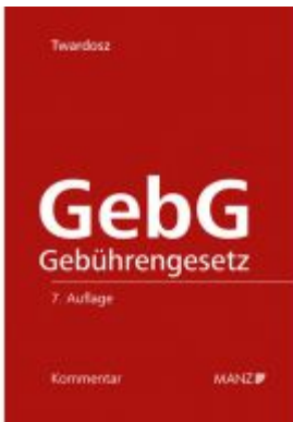
GebG - Kommentar zum Gebührengesetz Ladenpreis: 158,00 EUR