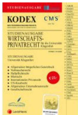
KODEX Wirtschaftsprivatrecht Klausenfurt Ladenpreis: 23,00 EUR