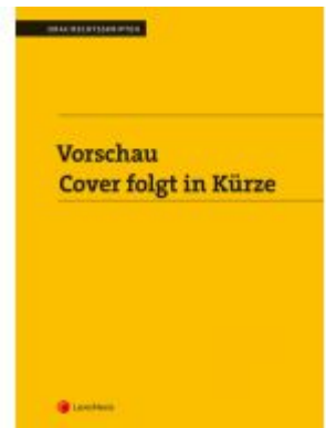
Personengesellschaften (Skriptum) Ladenpreis: 18,00 EUR