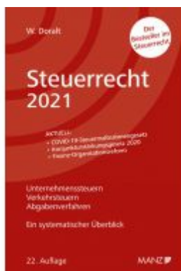
Steuerrecht 2021 Ladenpreis: 36,00 EUR