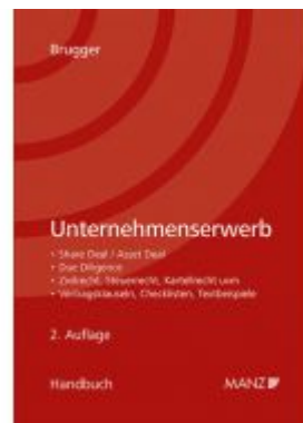
Handbuch Unternehmenserwerb Ladenpreis: 158,00 EUR