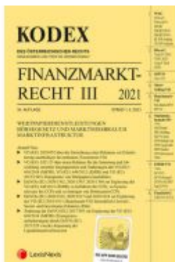
Kodex Finanzmarktrecht Band III 2021 Ladenpreis: 81,00 EUR