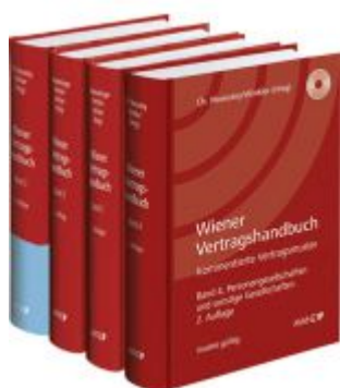
PAKET: Wiener Vertragshandbuch Ladenpreis: 678,00 EUR