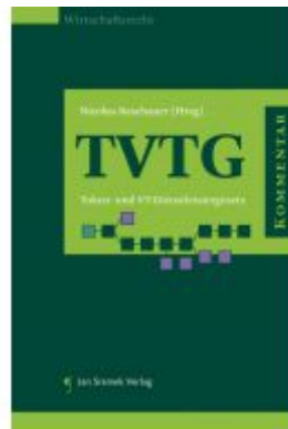
Kommentar zum TVTG Ladenpreis: 148,00 EUR