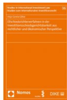
Eilschiedsrichterverfahren in der Investitionsschiedsgerichtsbarkeit aus rechtlicher und ökonomischer Perspektive Ladenpreis: 74,00 EUR