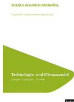
Technologie und Klimawandel (FH Burgenland Bd. 22) Ladenpreis: 45,00 EUR