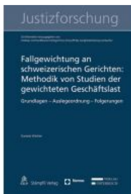
Fallgewichtung an schweizerischen Gerichten: Methodik von Studien der gewichteten Geschäftslast Ladenpreis: 107,57 EUR