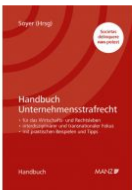
Handbuch Unternehmensstrafrecht Ladenpreis: 118,00 EUR