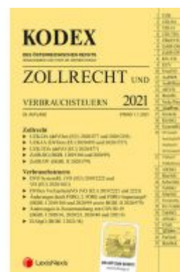
KODEX Zollrecht 2021 - inkl. App Ladenpreis: 116,00 EUR