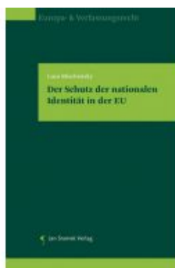
Der Schutz der nationalen Identität in der EU Ladenpreis: 78,00 EUR