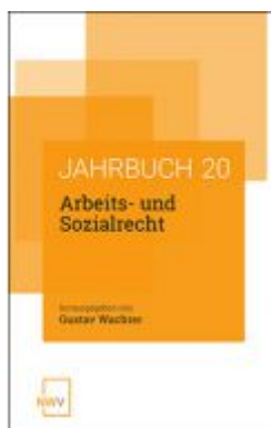
Arbeits- und Sozialrecht Ladenpreis: 54,00 EUR