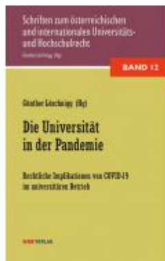
Die Universität in der Pandemie Ladenpreis: 34,00 EUR

Wir haben andere Produkte gefunden, die Ihnen gefallen könnten!