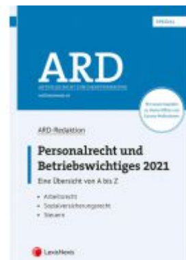
Personalrecht und Betriebswichtiges 2021 Ladenpreis: 80,00 EUR