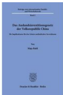
Das Auslandsinvestitionsgesetz der Volksrepublik China Ladenpreis: 102,70EUR