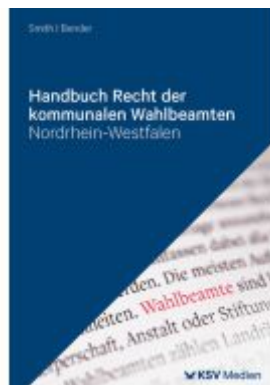
Handbuch Recht der kommunalen Wahlbeamten Nordrhein-Westfalen Ladenpreis: 81,30EUR