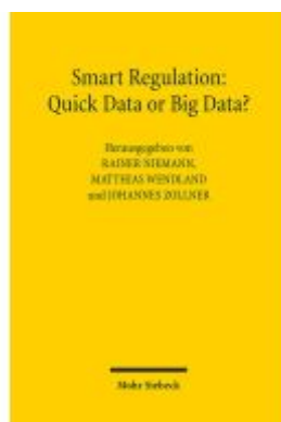
Smart Regulation: Quick Data or Big Data? Ladenpreis: 60,70EUR