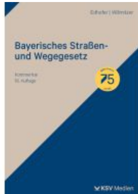
Bayerisches Straßen- und Wegegesetz Ladenpreis: 81,30EUR