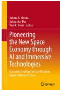
Pioneering the New Space Economy through AI and Immersive Technologies Ladenpreis: 186,99EUR