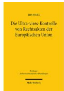
Die Ultra-vires-Kontrolle von Rechtsakten der Europäischen Union Ladenpreis: 112,10EUR