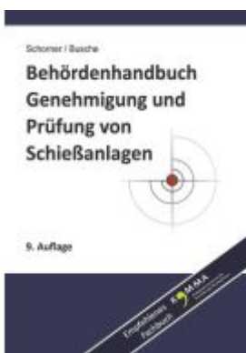
Behördenhandbuch Genehmigung und Prüfung von Schießanlagen Ladenpreis: 65,80EUR