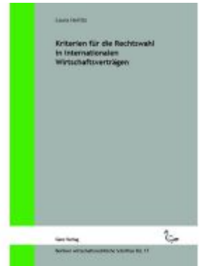
Kriterien für die Rechtswahl in internationalen Wirtschaftsverträgen Ladenpreis: 36,00EUR