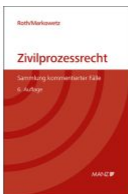
Zivilprozessrecht Sammlung kommentierter Fälle Ladenpreis: 46,00EUR