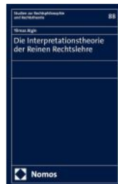
Die Interpretationstheorie der Reinen Rechtslehre Ladenpreis: 81,30EUR