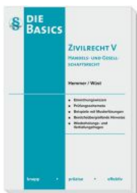
Basics Zivilrecht V - Handels- und Gesellschaftsrecht Ladenpreis: 20,50EUR