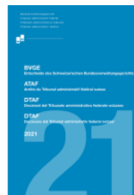
BVGE 2021 Ladenpreis: 90,00EUR