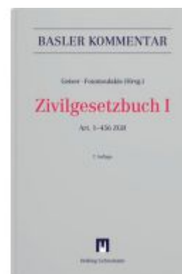
Zivilgesetzbuch I Ladenpreis: 658,00EUR