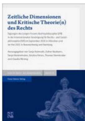
Zeitliche Dimensionen und Kritische Theorie(n) des Rechts Ladenpreis: 74,10EUR