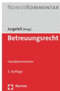
Betreuungsrecht Ladenpreis: 132,70EUR