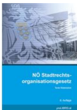
NÖ Stadtrechtsorganisationsgesetz Ladenpreis: 26,00EUR