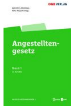
Angestellten-gesetz Ladenpreis: 129,00EUR