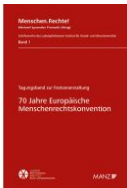
70 Jahre Europäische Menschenrechtskonvention Ladenpreis: 42,00EUR