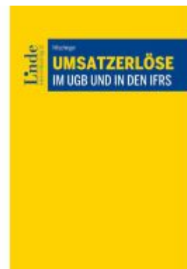
Umsatzerlöse im UGB und in den IFRS Ladenpreis: 78,00EUR