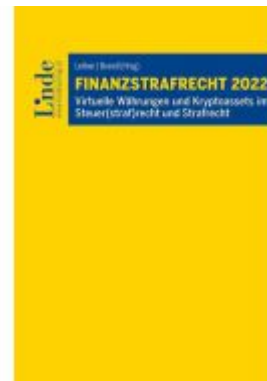
Finanzstrafrecht 2022 Ladenpreis: 59,00EUR