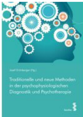
Traditionelle und neue Methoden in der psychophysiologischen Diagnostik und Psychotherapie Ladenpreis: 19,90EUR