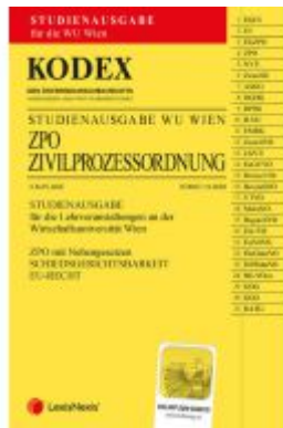
KODEX ZPO für die WU 2023/24 - inkl. App Ladenpreis: 21,00EUR