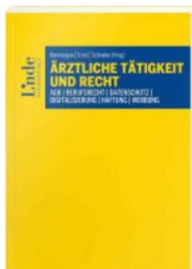
Ärztliche Tätigkeit und Recht Ladenpreis: 48,00EUR