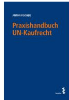
Praxishandbuch UN-Kaufrecht Ladenpreis: 48,00EUR