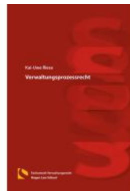
Verwaltungsprozessrecht Ladenpreis: 50,40EUR