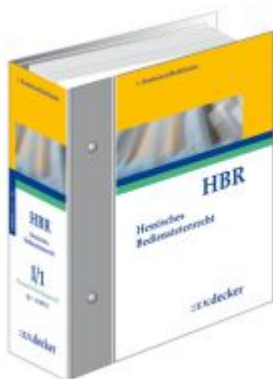
Hessisches Bedienstetenrecht - HBR Ladenpreis: 623,00EUR