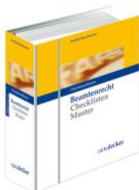
Beamtenrecht Ladenpreis: 451,40EUR