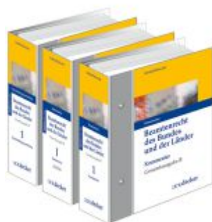
Beamtenrecht des Bundes und der Länder - Gesamtausgabe Ladenpreis: 462,70EUR