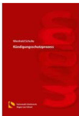
Kündigungsschutzprozess Ladenpreis: 25,70EUR