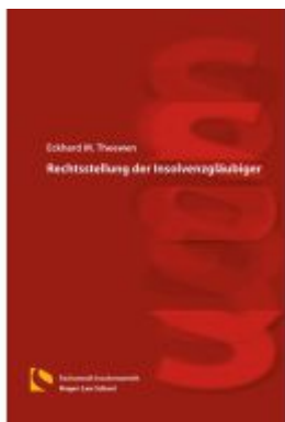
Rechtsstellung der Insolvenzgläubiger Ladenpreis: 36,00EUR