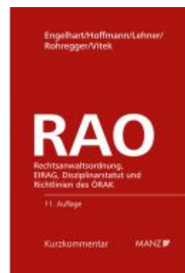
Rechtsanwaltsordnung RAO Ladenpreis: 210,00EUR