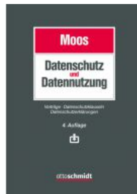
Datenschutz und Datennutzung Ladenpreis: 153,20EUR