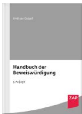
Handbuch der Beweiswürdigung Ladenpreis: 173,80EUR