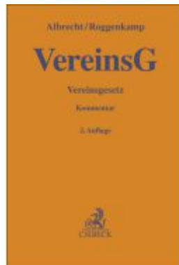
Vereinsgesetz (VereinsG) Ladenpreis: 132,70EUR