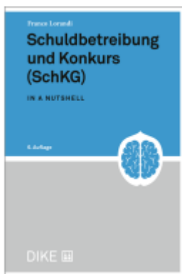
Schuldbetreibung und Konkurs (SchKG) Ladenpreis: 52,00EUR