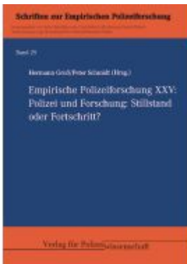
Empirische Polizeiforschung XXV: Ladenpreis: 35,90EUR

Wir haben andere Produkte gefunden, die Ihnen gefallen könnten!