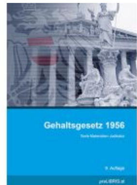
Gehaltsgesetz 1956 Ladenpreis: 41,00EUR