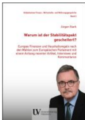
Warum ist der Stabilitätspakt gescheitert? Ladenpreis: 34,50EUR