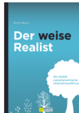
Der weise Realist Ladenpreis: 25,70EUR