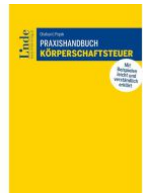
Praxishandbuch Körperschaftsteuer Ladenpreis: 59,00EUR