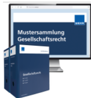
Mustersammlung Gesellschaftsrecht Ladenpreis: 264,00EUR