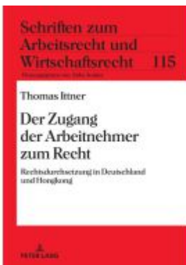
Der Zugang der Arbeitnehmer zum Recht Ladenpreis: 56,50EUR