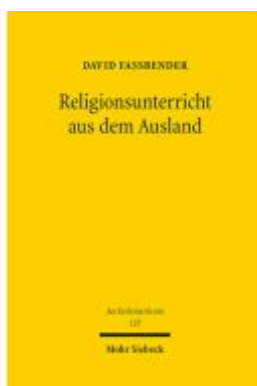
Religionsunterricht aus dem Ausland Ladenpreis: 112,10EUR