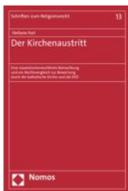
Der Kirchenaustritt Ladenpreis: 91,50EUR