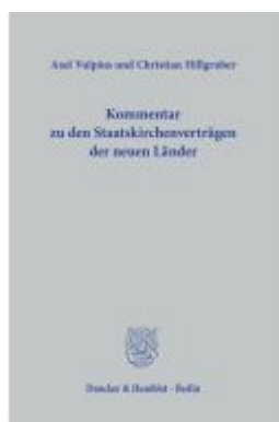
Kommentar zu den Staatskirchenverträgen der neuen Länder. Ladenpreis: 133,60EUR