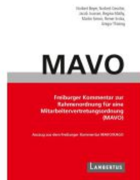
Handbuch MAVO-Kommentar Ladenpreis: 87,40EUR