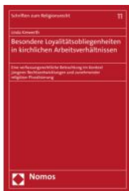
Besondere Loyalitätsobliegenheiten in kirchlichen Arbeitsverhältnissen Ladenpreis: 121,40EUR