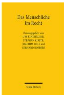
Das Menschliche im Recht Ladenpreis: 60,70EUR