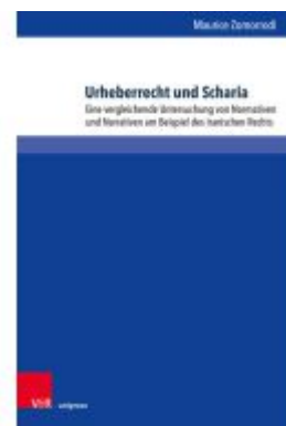
Urheberrecht und Scharia Ladenpreis: 57,00EUR