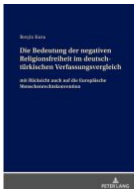
Die Bedeutung der negativen Religionsfreiheit im deutsch-türkischen Verfassungsvergleich Ladenpreis: 61,05EUR