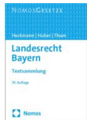
Landesrecht Bayern Ladenpreis: 30,80EUR