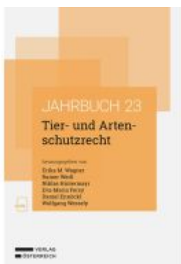
Tier- und Artenschutzrecht Ladenpreis: 78,00EUR