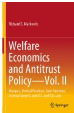
Welfare Economics and Antitrust Policy — Vol. II Ladenpreis: 65,99EUR