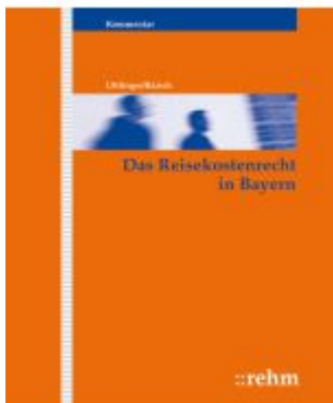
Das Reisekostenrecht in Bayern Ladenpreis: 522,30EUR

Wir haben andere Produkte gefunden, die Ihnen gefallen könnten!