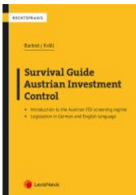
Survival Guide Austrian Investment Control Ladenpreis: 24,00EUR