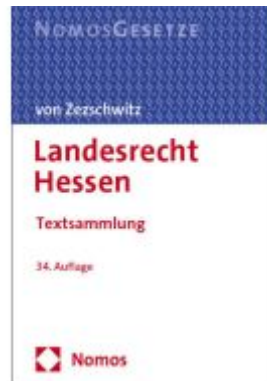
Landesrecht Hessen Ladenpreis: 30,80EUR