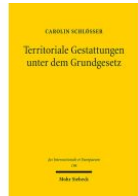
Territoriale Gestattungen unter dem Grundgesetz Ladenpreis: 81,30EUR