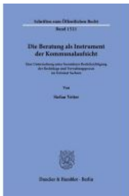
Die Beratung als Instrument der Kommunalaufsicht. Ladenpreis: 102,70EUR