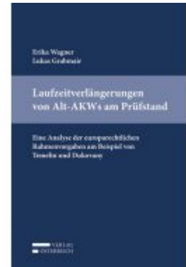
Laufzeitverlängerungen von Alt-AKW's am Prüfstand Ladenpreis: 45,00 EUR