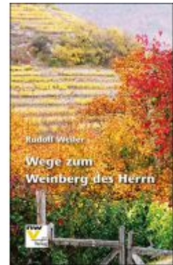
Wege zum Weinberg des Herrn Ladenpreis: 24,00 EUR