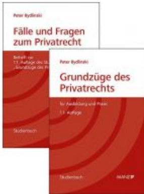
PAKET: Grundzüge des Privatrechts + Fälle und Fragen zum Privatrecht 11. Auflage Ladenpreis: 64,00 EUR