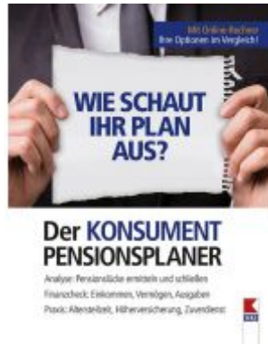
Der KONSUMENT-Pensionsplaner Ladenpreis: 19,90 EUR