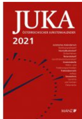
Österreichischer Juristenkalender 2021 JuKa Ladenpreis: 129,00 EUR