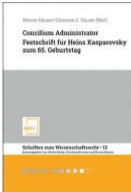
Concilium Administrator Ladenpreis: 68,00 EUR