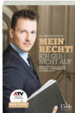
Mein Recht - Ich geb nicht auf Ladenpreis: 19,90 EUR