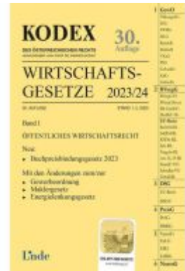
KODEX Wirtschaftsgesetze Band I 2023/24 Ladenpreis: 62,00EUR