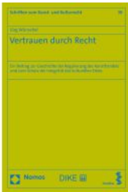
Vertrauen durch Recht Ladenpreis: 101,80EUR