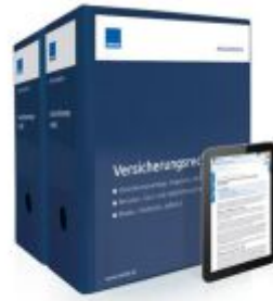
Versicherungsrecht Ladenpreis: 261,80EUR