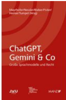
ChatGPT, Gemini & Co Ladenpreis: 48,00EUR