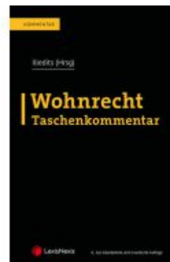
Wohnrecht Taschenkommentar Ladenpreis: 229,00EUR