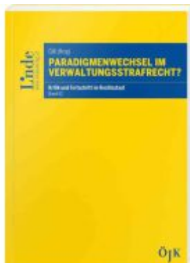
Paradigmenwechsel im Verwaltungsstrafrecht? Ladenpreis: 22,00EUR