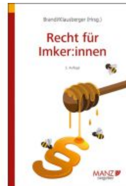
Recht für Imker:innen Ladenpreis: 23,80EUR