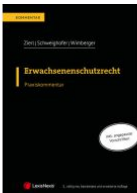
Erwachsenenschutzrecht Ladenpreis: 129,00EUR