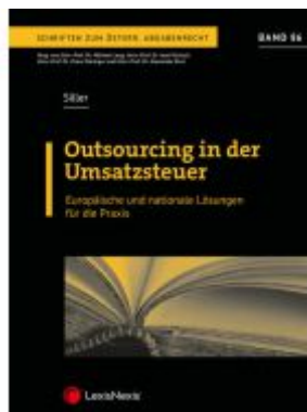
Outsourcing in der Umsatzsteuer Ladenpreis: 82,00 EUR