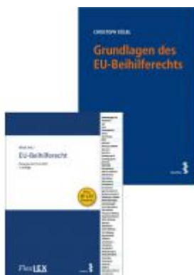
Kombipaket Grundlagen des EU- Beihilferechts und FlexLex EU-Beihilferecht Ladenpreis: 82,00 EUR