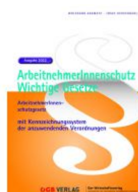
ArbeitnehmerInnenschutz. Ladenpreis: 46,00 EUR