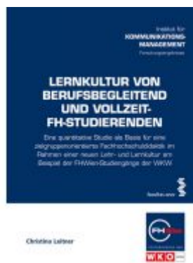
Lernkultur von berufsbegleitend und Vollzeit-FH-Studierenden Ladenpreis: 22,00 EUR