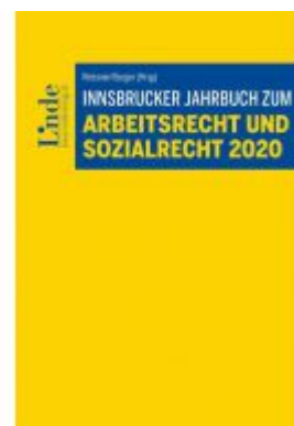
Innsbrucker Jahrbuch zum Arbeits- und Sozialrecht 2020 Ladenpreis: 52,00 EUR