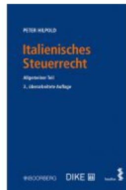
Italienisches Steuerrecht Ladenpreis: 46,00 EUR