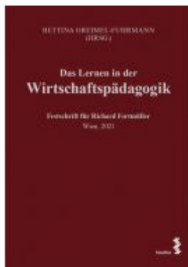
Das Lernen in der Wirtschaftspädagogik Ladenpreis: 34,00 EUR