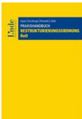
Praxishandbuch Restrukturierungsordnung I ReO Ladenpreis: 76,00 EUR