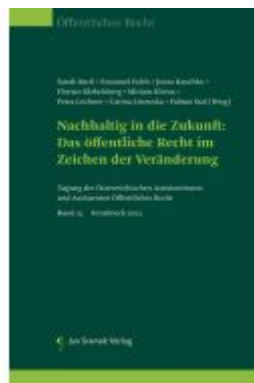
Nachhaltig in die Zukunft: Das öffentliche Recht im Zeichen der Veränderung Ladenpreis: 85,00EUR