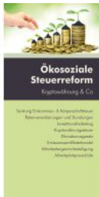
Ökosoziale Steuerreform Ladenpreis: 12,60EUR