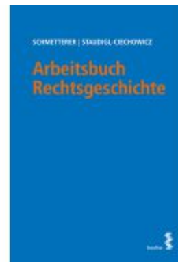
Arbeitsbuch Rechtsgeschichte Ladenpreis: 14,00EUR