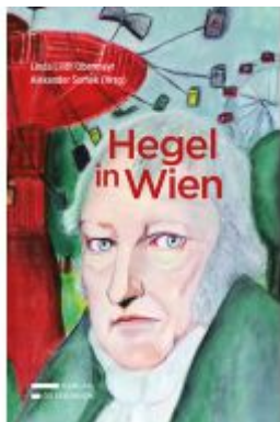
Hegel in Wien Ladenpreis: 55,00EUR