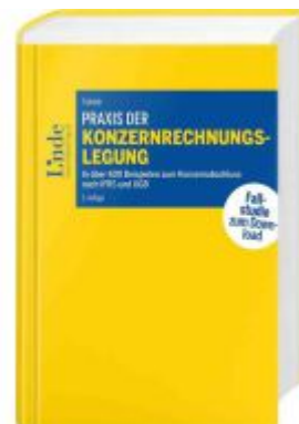
Praxis der Konzernrechnungslegung Ladenpreis: 178,00EUR