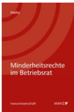
Minderheitsrechte im Betriebsrat Ladenpreis: 109,00EUR