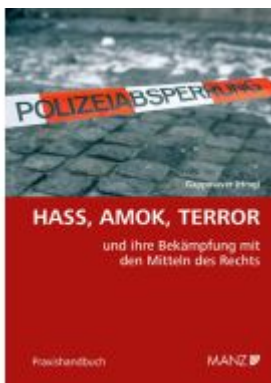
Hass, Amok, Terror und ihre Bekämpfung mit den Mitteln des Rechts Ladenpreis: 64,00EUR