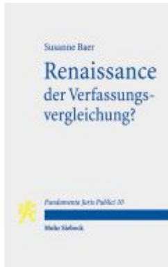
Renaissance der Verfassungsvergleichung? Ladenpreis: 18,50EUR