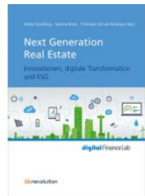
Next Generation Real Estate Ladenpreis: 54,20EUR