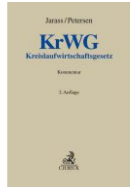
Kreislaufwirtschaftsgesetz Ladenpreis: 184,10EUR