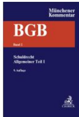
Münchener Kommentar zum Bürgerlichen Gesetzbuch Bd. 2: Schuldrecht - Allgemeiner Teil I Ladenpreis: 204,60EUR