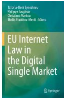
EU Internet Law in the Digital Single Market Ladenpreis: 252,99EUR