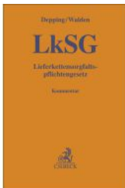
LkSG Ladenpreis: 132,70EUR