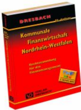
Kommunale Finanzwirtschaft Nordrhein- Westfalen Ladenpreis: 63,80EUR