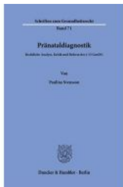
Pränataldiagnostik. Ladenpreis: 92,50EUR