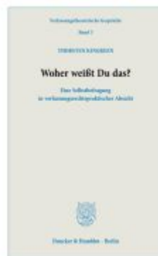
Woher weißt Du das? Ladenpreis: 61,60EUR