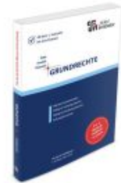
Grundrechte Ladenpreis: 34,90EUR