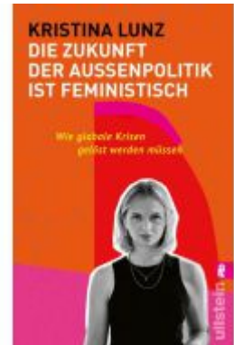
Die Zukunft der Außenpolitik ist feministisch Ladenpreis: 15,50EUR