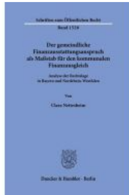
Der gemeindliche Finanzausstattungsanspruch als Maßstab für den kommunalen Finanzausgleich. Ladenpreis: 102,70EUR