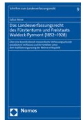
Das Landesverfassungsrecht des Fürstentums und Freistaats Waldeck-Pyrmont (1852-1928) Ladenpreis: 184,10EUR