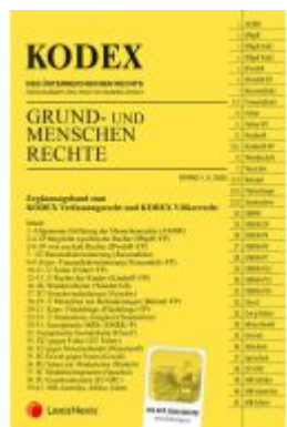
KODEX Grund- und Menschenrechte - inkl. App Ladenpreis: 24,00EUR