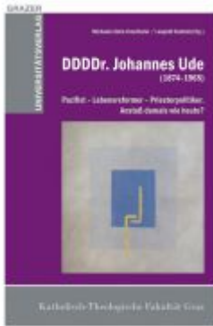
DDDDr. Johannes Ude (1874–1965) Ladenpreis: 19,90 EUR