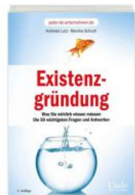
Existenzgründung Ladenpreis: 19,90 EUR