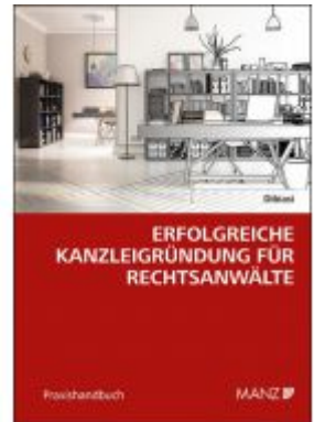
Erfolgreiche Kanzleigründung für Rechtsanwälte Ladenpreis: 34,00 EUR