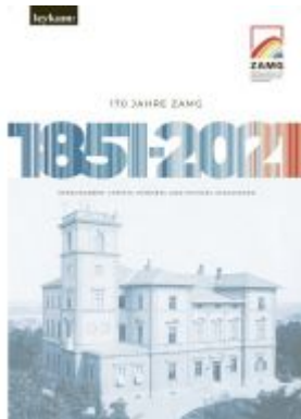
170 Jahre ZAMG 1851–2021 Ladenpreis: 30,00 EUR