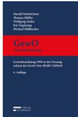
GewO Gewerbeordnung Ladenpreis: 489,00 EUR