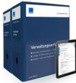
Mustersammlung Verwaltungsverfahren Ladenpreis: 228,90 EUR