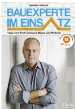
Bauexperte im Einsatz Ladenpreis: 14,90 EUR