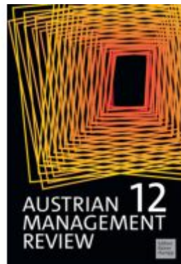
Austrian Management Review Ladenpreis: 35,00EUR