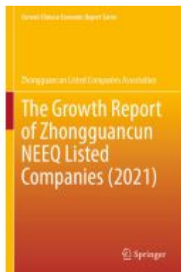
The Growth Report of Zhongguancun NEEQ Listed Companies (2021) Ladenpreis: 109,99EUR