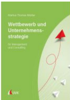
Wettbewerb und Unternehmensstrategie Ladenpreis: 30,80EUR