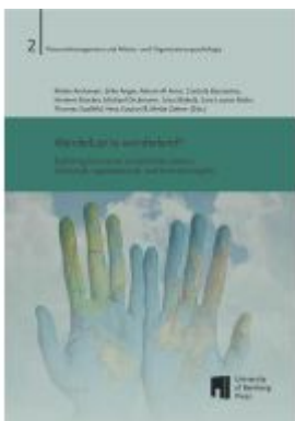
Wanderlust to wonderland? Ladenpreis: 24,70EUR