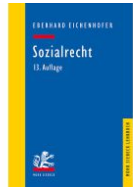
Sozialrecht Ladenpreis: 35,00EUR