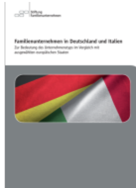
Familienunternehmen in Deutschland und Italien Ladenpreis: 20,50EUR