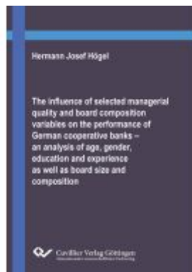
The influence of selected managerial quality and board composition variables on the performance of German cooperative banks – an analysis of age, gender, education and experience as well as board size and composition Ladenpreis: 102,70EUR