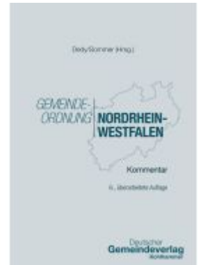
Gemeindeordnung Nordrhein-Westfalen Ladenpreis: 129,60EUR