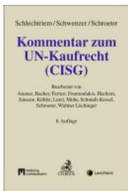
Kommentar zum UN-Kaufrecht (CISG) Ladenpreis: 276,60EUR