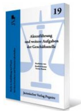
Aktenführung und weitere Aufgaben der Geschäftsstelle Ladenpreis: 35,00EUR