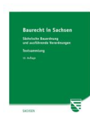
Baurecht in Sachsen Ladenpreis: 18,00EUR