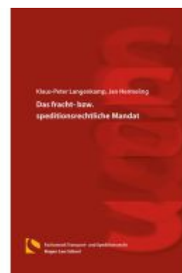
Das fracht- bzw. speditonsrechtliche Mandat Ladenpreis: 25,70EUR