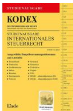
KODEX Studienausgabe Internationales Steuerrecht Ladenpreis: 20,00EUR