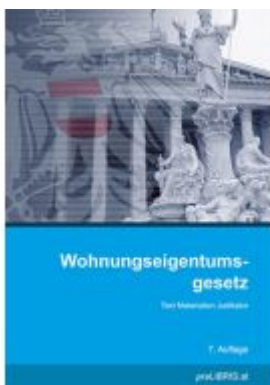
Wohnungseigentumsgesetz Ladenpreis: 31,00EUR