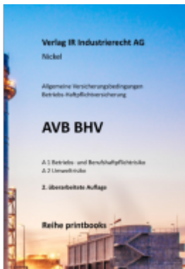
AVB BHV Kommentar Ladenpreis: 183,00EUR

Wir haben andere Produkte gefunden, die Ihnen gefallen könnten!