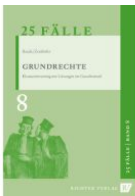
25 Fälle - Band 8 - Grundrechte Ladenpreis: 11,10EUR