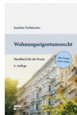
Wohnungseigentumsrecht Ladenpreis: 69,00 EUR