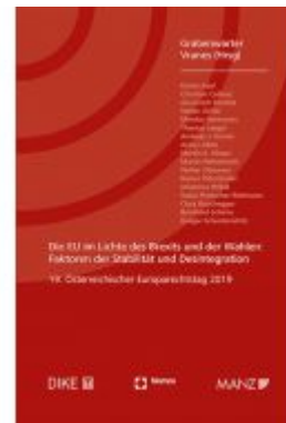
Die EU im Lichte des Brexits und der Wahlen Ladenpreis: 58,00 EUR