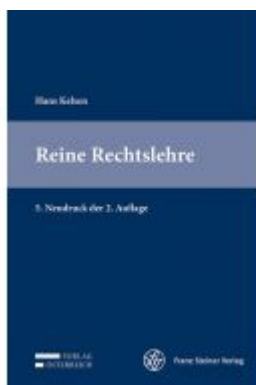
Reine Rechtslehre Ladenpreis: 79,00 EUR