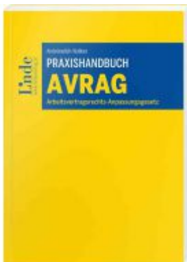
Praxishandbuch Arbeitsvertragsrechts- Anpassungsgesetz Ladenpreis: 54,00 EUR