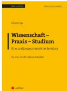
Wissenschaft – Praxis – Studium Ladenpreis: 32,00 EUR