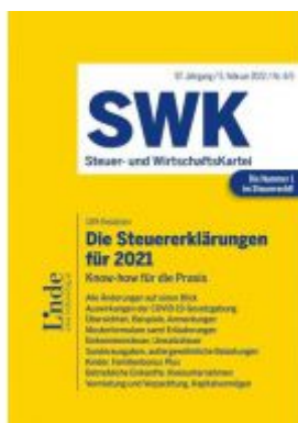
Die Steuererklärungen für 2021 Ladenpreis: 43,00 EUR