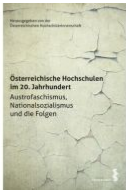
Österreichische Hochschulen im 20. Jahrhundert Ladenpreis: 24,90 EUR