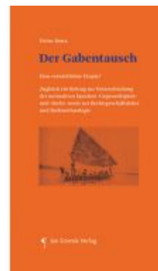
Der Gabentausch Ladenpreis: 24,90 EUR