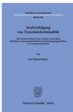
Strafverfolgung von Tierschutzkriminalität Ladenpreis: 92,50EUR