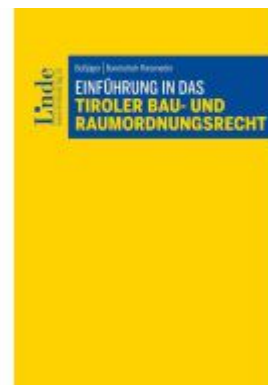
Einführung in das Tiroler Bau- und Raumordnungsrecht Ladenpreis: 49,00EUR