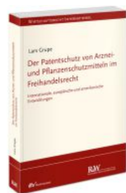
Der Patentschutz von Arznei- und Pflanzenschutzmitteln im Freihandelsrecht Ladenpreis: 91,50EUR