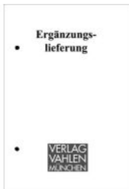
Betriebsrentenrecht (BetrAVG) Bd. 2 Steuerrecht / Sozialabgaben, HGB / IFRS 25. Ergänzungslieferung Ladenpreis: 51,20EUR