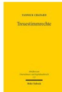
Treuestimmrechte Ladenpreis: 101,80EUR