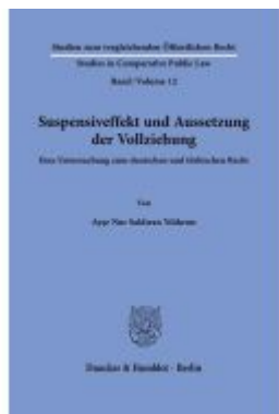
Suspensiveffekt und Aussetzung der Vollziehung. Ladenpreis: 92,50EUR