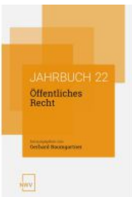
Öffentliches Recht Ladenpreis: 84,00EUR