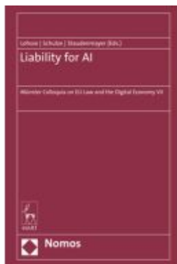
Liability for AI Ladenpreis: 91,50EUR