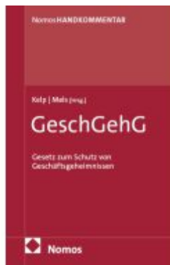
Gesetz zum Schutz von Geschäftsgeheimnissen: GeschGehG Ladenpreis: 122,40EUR