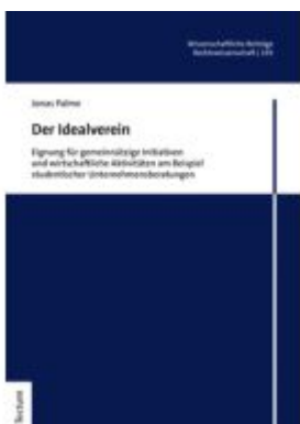
Der Idealverein Ladenpreis: 117,20EUR