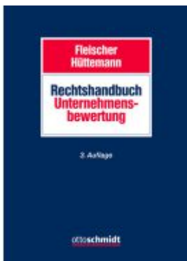
Rechtshandbuch Unternehmensbewertung Ladenpreis: 235,50EUR

Wir haben andere Produkte gefunden, die Ihnen gefallen könnten!