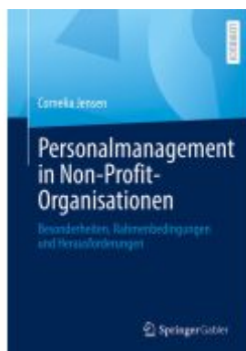
Personalmanagement in Non-Profit- Organisationen Ladenpreis: 25,69EUR