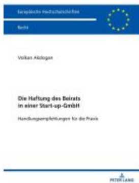
Die Haftung des Beirats in einer Start-up- GmbH Ladenpreis: 56,50EUR