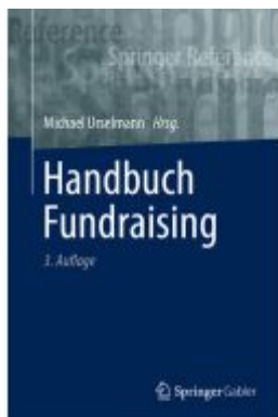
Handbuch Fundraising Ladenpreis: 133,63EUR