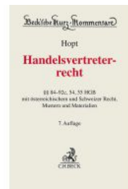
Handelsvertreterrecht Ladenpreis: 97,70EUR