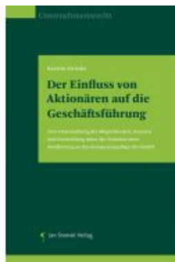
Der Einfluss von Aktionären auf die Geschäftsführung Ladenpreis: 78,00EUR