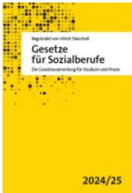
Gesetze für Sozialberufe Ladenpreis: 28,30EUR