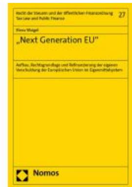
„Next Generation EU“ Ladenpreis: 71,00EUR