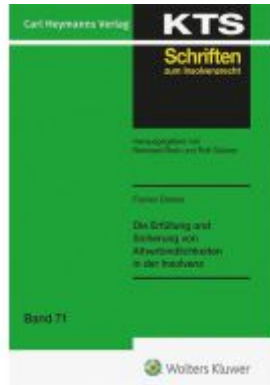
Die Erfüllung und Sicherung von Altverbindlichkeiten in der Insolvenz (KTS 71) Ladenpreis: 91,50EUR