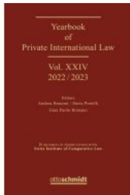
Yearbook of Private International Law Vol. XIV – 2022/2023 Ladenpreis: 286,90EUR