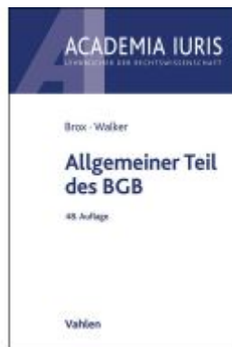
Allgemeiner Teil des BGB Ladenpreis: 26,70EUR