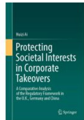
Protecting Societal Interests in Corporate Takeovers Ladenpreis: 153,99EUR