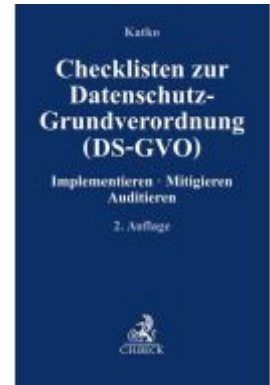
Checklisten zur Datenschutz- Grundverordnung (DS-GVO) Implementieren · Mitigieren Auditieren Ladenpreis: 50,40EUR