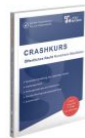
CRASHKURS Öffentliches Recht - NRW Ladenpreis: 26,70EUR