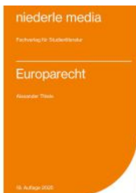
Europarecht - 2025 Ladenpreis: 22,70EUR