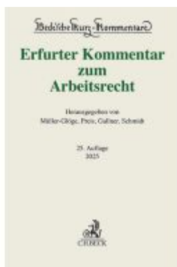
Erfurter Kommentar zum Arbeitsrecht Ladenpreis: 204,60EUR