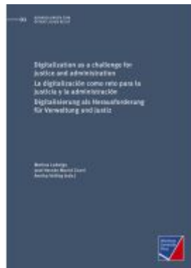
Digitalization as a challenge for justice and administration Ladenpreis: 26,60EUR