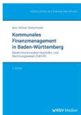
Kommunales Finanzmanagement in Baden-Württemberg Ladenpreis: 46,30EUR