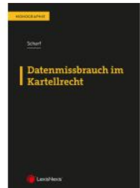
Datenmissbrauch im Kartellrecht Ladenpreis: 59,00EUR