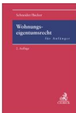
Wohnungseigentumsrecht für Anfänger Ladenpreis: 60,70EUR