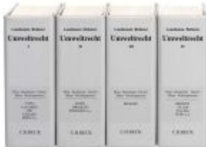
Umweltrecht Ladenpreis: 153,20EUR

Wir haben andere Produkte gefunden, die Ihnen gefallen könnten!