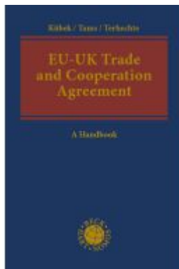
EU-UK Trade and Cooperation Agreement Ladenpreis: 226,20EUR