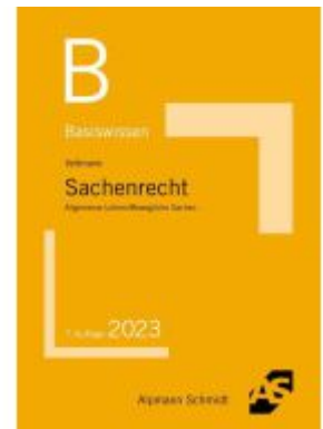
Basiswissen Sachenrecht Ladenpreis: 13,30EUR