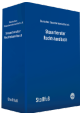
Steuerberater Rechtshandbuch Ladenpreis: 793,10EUR