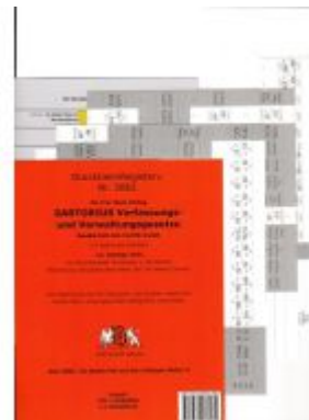
DürckheimRegister® SARTORIUS, Gesetze und §§, OHNE Stichworte Ladenpreis: 18,50EUR