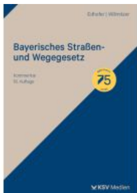
Bayerisches Straßen- und Wegegesetz Ladenpreis: 81,30EUR