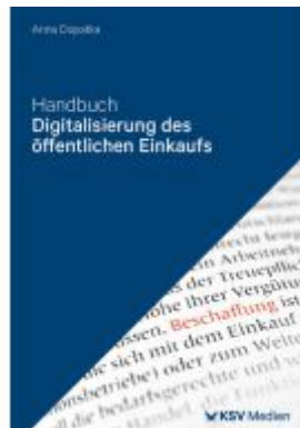
Handbuch Digitalisierung des öffentlichen Einkaufs Ladenpreis: 36,00EUR