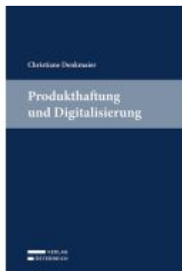
Produkt Haftung und Digitalisierung Ladenpreis: 69,00EUR