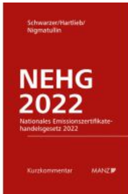
Nationales Emissionszertifikatehandelsgesetz 2022 NEHG 2022 Ladenpreis: 84,00EUR