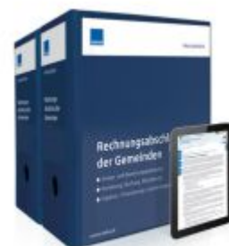
Rechnungsabschluss der Gemeinden Ladenpreis: 261,80EUR