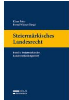
Steiermärkisches Landesrecht Ladenpreis: 52,00EUR