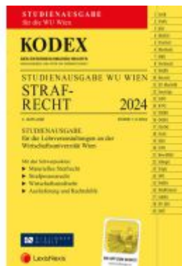
KODEX Strafrecht für die WU 2024 - inkl. App Ladenpreis: 19,00EUR