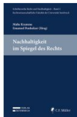
Nachhaltigkeit im Spiegel des Rechts Ladenpreis: 64,00EUR