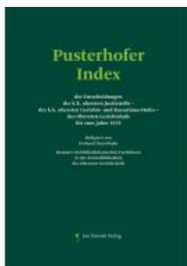
Pusterhofer Index Ladenpreis: 198,00EUR