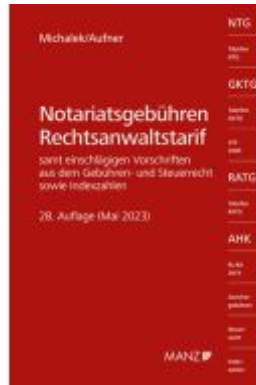
Notariatsgebühren - Rechtsanwaltstarif Ladenpreis: 69,00EUR