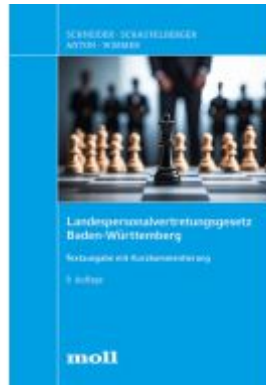
Landespersonalvertretungsgesetz Baden- Württemberg Ladenpreis: 55,60EUR