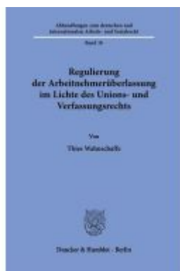
Regulierung der Arbeitnehmerüberlassung im Lichte des Unions- und Verfassungsrechts. Ladenpreis: 143,90EUR