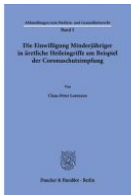
Die Einwilligung Minderjähriger in ärztliche Heileingriffe am Beispiel der Coronaschutzimpfung. Ladenpreis: 61,60EUR