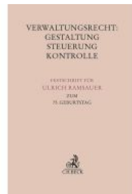
Verwaltungsrecht: Gestaltung, Steuerung, Kontrolle Ladenpreis: 153,20EUR