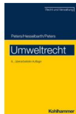
Umweltrecht Ladenpreis: 41,10EUR