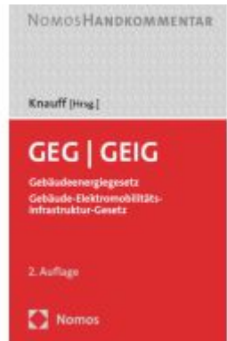
GEG - GEIG Ladenpreis: 163,50EUR