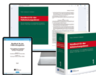
Handbuch für den Vollstreckungsdienst – Print + Digital Ladenpreis: 217,00EUR