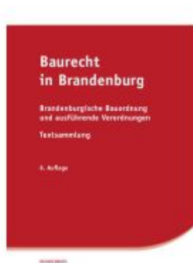
Baurecht in Brandenburg Ladenpreis: 20,50EUR