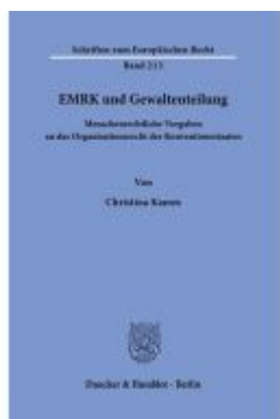
EMRK und Gewaltenteilung. Ladenpreis: 143,90EUR