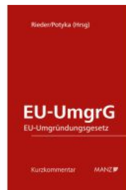
EU-Umgründungsgesetz Ladenpreis: 118,00EUR