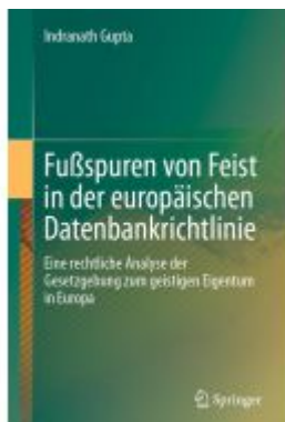
Fußspuren von Feist in der europäischen Datenbankrichtlinie Ladenpreis: 123,35EUR

Wir haben andere Produkte gefunden, die Ihnen gefallen könnten!