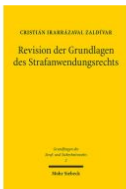
Revision der Grundlagen des Strafanwendungsrechts Ladenpreis: 107,00EUR