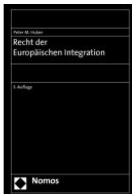
Recht der Europäischen Integration Ladenpreis: 100,80EUR