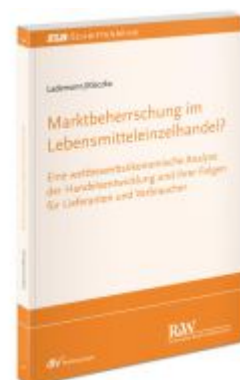
Marktbeherrschung im Lebensmitteleinzelhandel? Ladenpreis: 71,00EUR