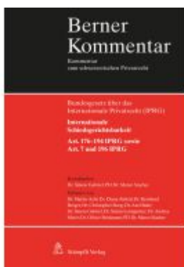
Internationale Schiedsgerichtsbarkeit, Art. 176-194 IPRG sowie Art. 7 und 196 IPRG Ladenpreis: 574,80EUR