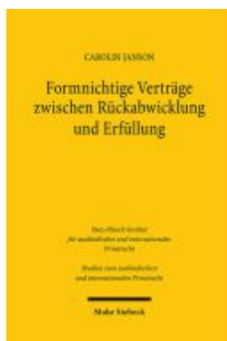
Formnichtige Verträge zwischen Rückabwicklung und Erfüllung Ladenpreis: 86,40EUR