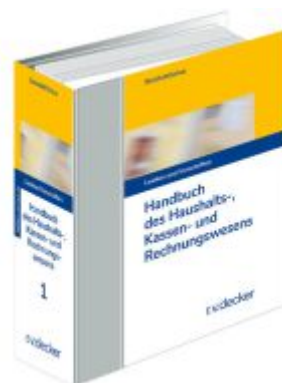
Handbuch des Haushalts-, Kassen- und Rechnungswesens Ladenpreis: 272,50EUR