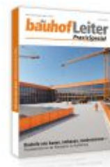
bauhofLeiter-PraxisSpezial: Bauhöfe neu bauen, umbauen, modernisieren Ladenpreis: 75,60EUR