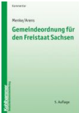
Gemeindeordnung für den Freistaat Sachsen Ladenpreis: 39,10EUR