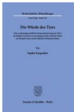
Die Würde des Tiers. Ladenpreis: 82,20EUR