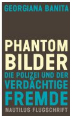
Phantombilder Ladenpreis: 24,70EUR