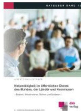
Nebentätigkeit im öffentlichen Dienst des Bundes, der Länder und Kommunen Ladenpreis: 35,90EUR