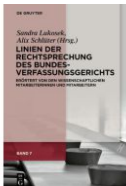
Linien der Rechtsprechung des Bundesverfassungsgerichts Ladenpreis: 159,95EUR