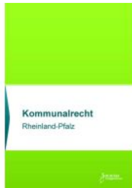
Kommunalrecht Rheinland-Pfalz Ladenpreis: 30,90EUR