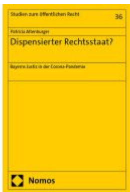
Dispensierter Rechtsstaat? Ladenpreis: 101,80EUR