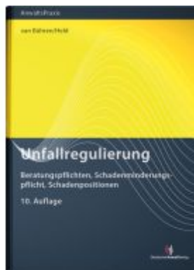
Unfallregulierung Ladenpreis: 50,40EUR