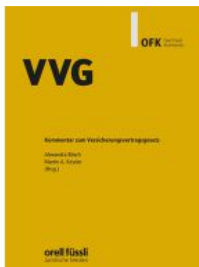
VVG Kommentar Ladenpreis: 183,00EUR