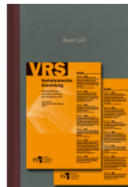
Verkehrsrechts-Sammlung (VRS). Entscheidungen aus allen Gebieten des Verkehrsrechts / Verkehrsrechts- Sammlung (VRS) Band 147 Ladenpreis: 121,40EUR