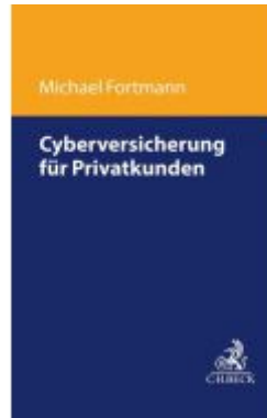
Verbraucher-Cyberversicherung Ladenpreis: 91,50EUR