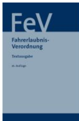
Fahrerlaubnisverordnung Ladenpreis: 17,40EUR