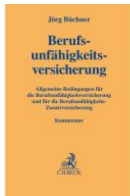
Berufs-unfähigkeits-versicherung Ladenpreis: 102,80EUR