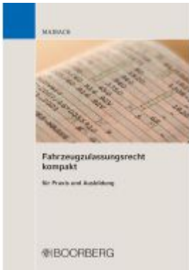
Fahrzeugzulassungsrecht kompakt Ladenpreis: 40,10EUR

Wir haben andere Produkte gefunden, die Ihnen gefallen könnten!