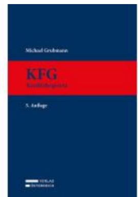
KFG Ladenpreis: 399,00EUR