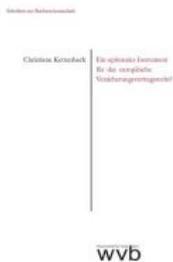
Ein optionales Instrument für das europäische Versicherungsvertragsrecht? Ladenpreis: 40,10EUR