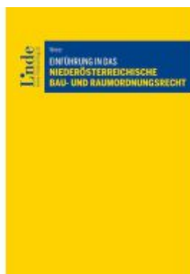
Einführung in das niederösterreichische Bau- und Raumordnungsrecht Ladenpreis: 56,00EUR