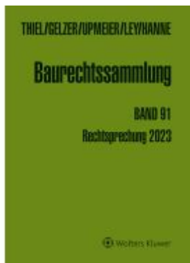
Baurechtssammlung. Rechtsprechung des Bundesverwaltungsgerichts,... / Baurechtssammlung Band 91 Ladenpreis: 203,60EUR