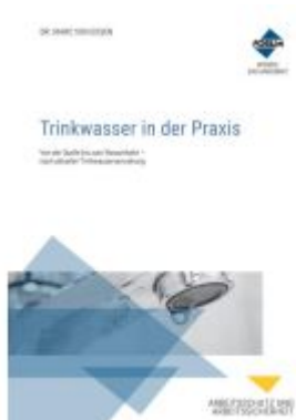
Trinkwasser in der Praxis Ladenpreis: 132,70EUR