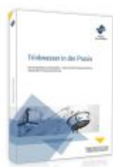
Trinkwasser in der Praxis Ladenpreis: 74,10EUR