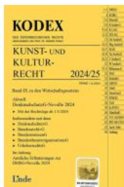
KODEX Kunst- und Kulturrecht 2024/25 Ladenpreis: 37,00EUR