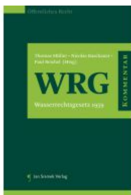
WRG - Kommentar zum Wasserrechtsgesetz Ladenpreis: 268,00EUR