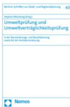
Umweltprüfung und Umweltverträglichkeitsprüfung Ladenpreis: 76,10EUR