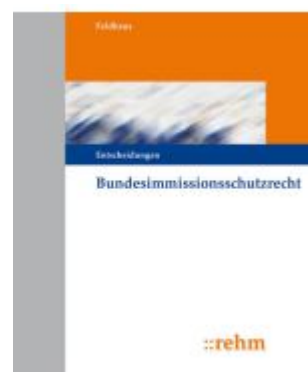
Bundesimmissionsschutzrecht - Entscheidungen Ladenpreis: 813,20EUR