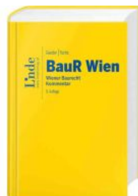
BauR Wien | Wiener Baurecht Ladenpreis: 140,00EUR