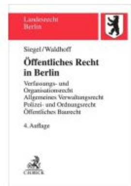
Öffentliches Recht in Berlin Ladenpreis: 45,20EUR