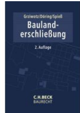
Baulanderschließung Ladenpreis: 71,00EUR