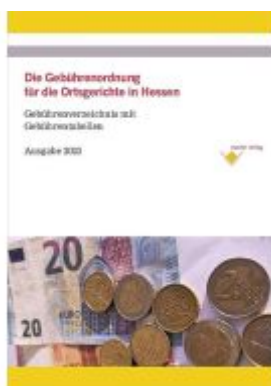
Die Gebührenordnung für die Ortsgerichte im Lande Hessen Ladenpreis: 13,90EUR