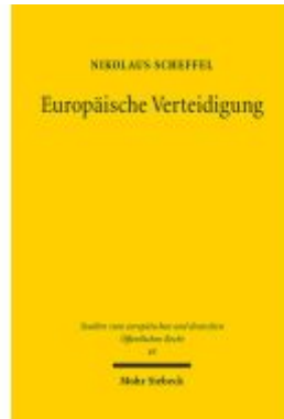
Europäische Verteidigung Ladenpreis: 86,40EUR