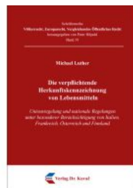
Die verpflichtende Herkunftskennzeichnung von Lebensmitteln Ladenpreis: 76,90EUR