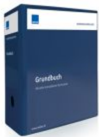
Normensammlung Grundbuch Ladenpreis: 118,80EUR