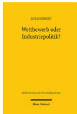
Wettbewerb oder Industriepolitik? Ladenpreis: 92,60EUR