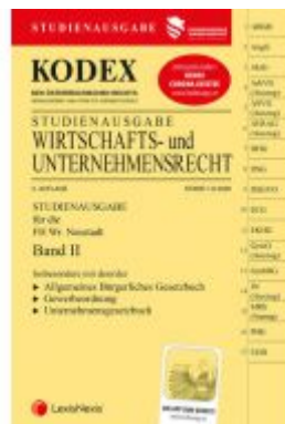
KODEX Wirtschafts- und Unternehmensrecht 2020 Band II Ladenpreis: 22,50 EUR