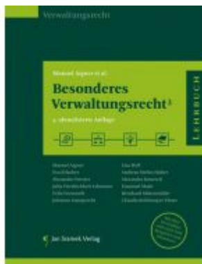
Besonderes Verwaltungsrecht 3 Ladenpreis: 55,00 EUR

Wir haben andere Produkte gefunden, die Ihnen gefallen könnten!