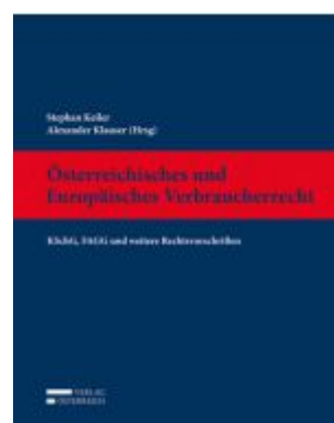
Österreichisches und Europäisches Verbraucherrecht Aktionspreis: 56,00 EUR Ladenpreis: 89,00 EUR