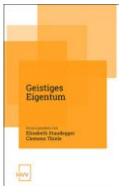
Geistiges Eigentum Ladenpreis: 68,00 EUR