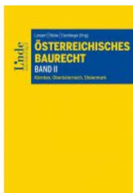
Österreichisches Baurecht Band II Ladenpreis: 39,00 EUR