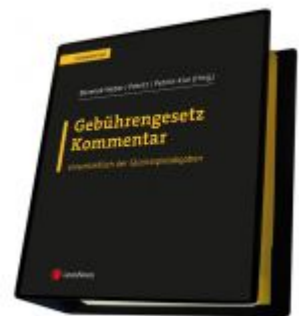
Gebührengesetz Kommentar Ladenpreis: 198,00 EUR