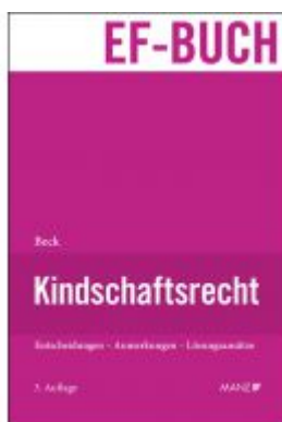
Kindschaftsrecht Ladenpreis: 168,00 EUR