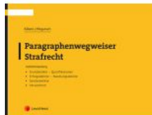
Paragrafenwegweiser Strafrecht Ladenpreis: 12,00 EUR