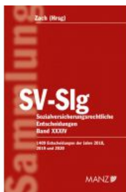
Sozialversicherungsrechtliche Entscheidungen SV-Slg Ladenpreis: 379,00 EUR