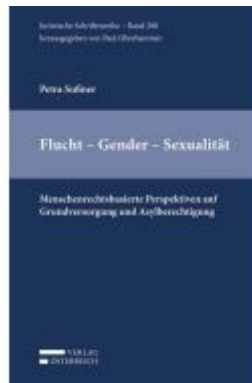
Flucht - Geschlecht - Sexualität Ladenpreis: 98,00 EUR