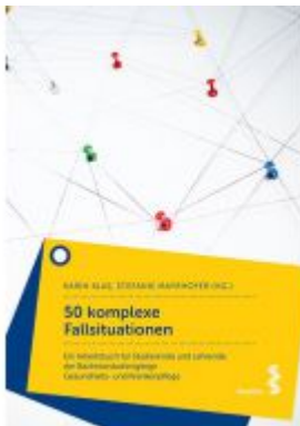
50 komplexe Fallsituationen Ladenpreis: 22,90 EUR