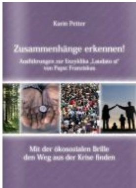
Zusammenhänge erkennen! Ladenpreis: 9,90 EUR