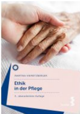
Ethik in der Pflege Ladenpreis: 19,90 EUR