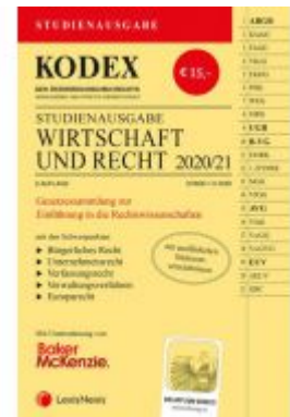
KODEX Wirtschaft und Recht 2020/21 Ladenpreis: 15,00 EUR