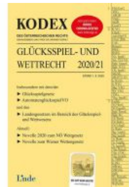
KODEX Glücksspiel- und Wettrecht 2020/21 Ladenpreis: 68,00 EUR