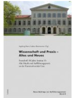
Wissenschaft und Praxis – Altes und Neues Ladenpreis: 19,90 EUR