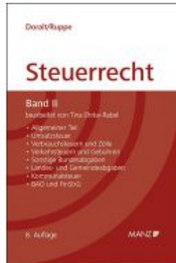
Grundriss des österreichischen Steuerrechts Ladenpreis: 68,00 EUR