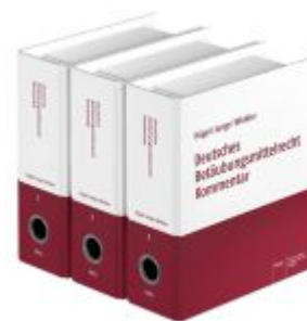
Hügel / Junge / Winkler Deutsches Betäubungsmittelrecht – Kommentar Ladenpreis: 127,50EUR