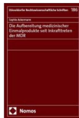
Die Aufbereitung medizinischer Einmalprodukte seit Inkrafttreten der MDR Ladenpreis: 76,10EUR