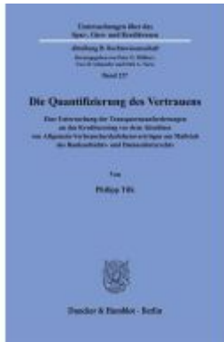
Die Quantifizierung des Vertrauens. Ladenpreis: 113,00EUR