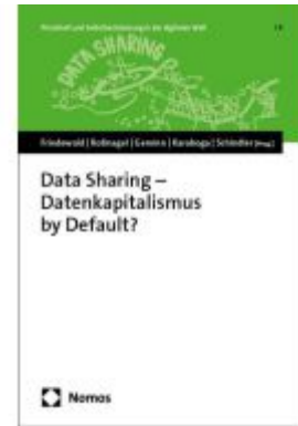
Data Sharing – Datenkapitalismus by Default? Ladenpreis: 86,40EUR