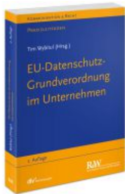
EU-Datenschutz-Grundverordnung im Unternehmen Ladenpreis: 60,70EUR