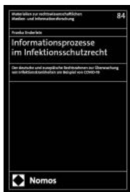
Informationsprozesse im Infektionsschutzrecht Ladenpreis: 122,40EUR