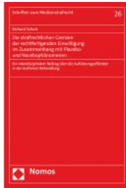
Die strafrechtlichen Grenzen der rechtfertigenden Einwilligung im Zusammenhang mit Placebo- und Nocebophänomenen Ladenpreis: 81,30EUR