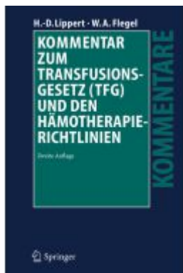
Kommentar zum Transfusionsgesetz (TFG) und den Hämotherapie-Richtlinien Ladenpreis: 92,48EUR