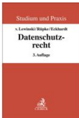
Datenschutzrecht Ladenpreis: 51,20EUR