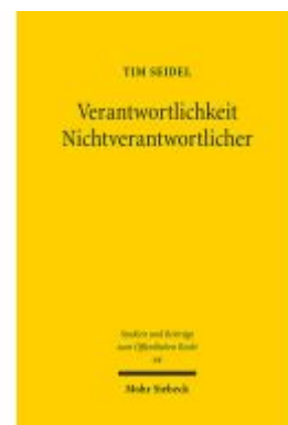
Verantwortlichkeit Nichtverantwortlicher Ladenpreis: 76,10EUR