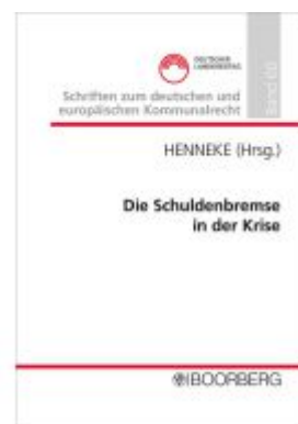
Die Schuldenbremse in der Krise Ladenpreis: 46,30EUR