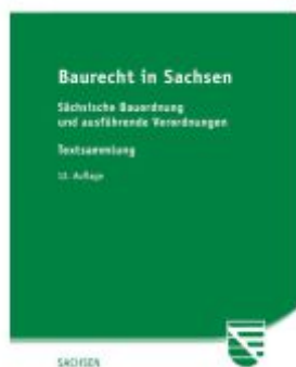
Baurecht in Sachsen Ladenpreis: 18,00EUR