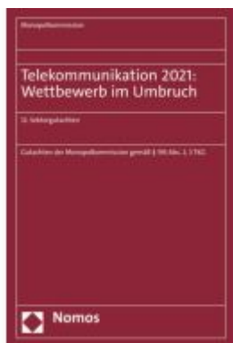
Telekommunikation 2021: Wettbewerb im Umbruch Ladenpreis: 47,30EUR