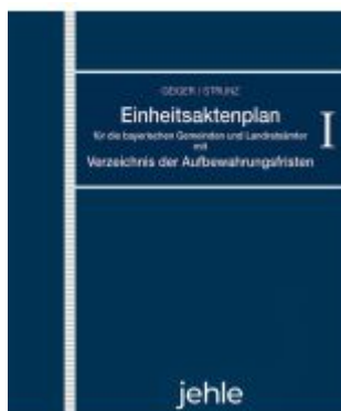
Einheitsaktenplan für die bayerischen Gemeinden und Landratsämter mit Verzeichnis der Aufbewahrungsfristen Ladenpreis: 204,60EUR