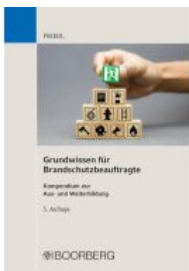
Grundwissen für Brandschutzbeauftragte Ladenpreis: 30,70EUR