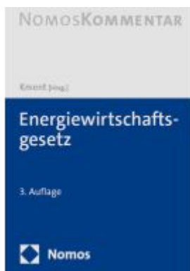
Energiewirtschaftsgesetz: EnWG Ladenpreis: 256,00EUR