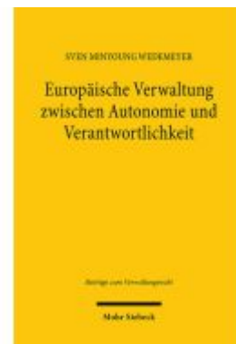
Europäische Verwaltung zwischen Autonomie und Verantwortlichkeit Ladenpreis: 112,10EUR