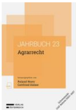
Agrarrecht Ladenpreis: 78,00EUR