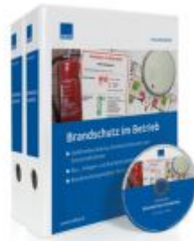
Brandschutz im Betrieb Ladenpreis: 217,80 EUR