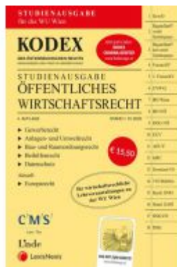
KODEX Öffentliches Wirtschaftsrecht 2020/21 Ladenpreis: 15,50 EUR