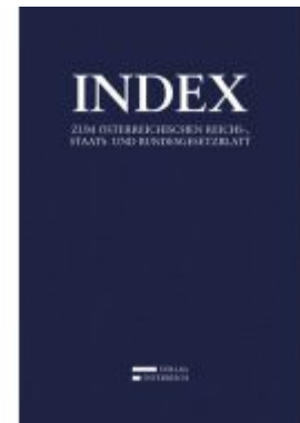
Index Ladenpreis: 389,00 EUR