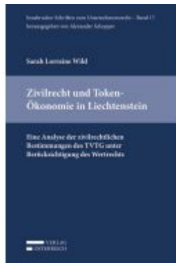
Zivilrecht und Token-Ökonomie in Liechtenstein Ladenpreis: 39,00 EUR

Wir haben andere Produkte gefunden, die Ihnen gefallen könnten!