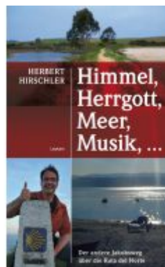
Himmel, Herrgott, Meer, Musik, ... Ladenpreis: 21,00 EUR