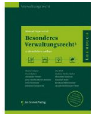
Besonderes Verwaltungsrecht 3 Ladenpreis: 55,00 EUR