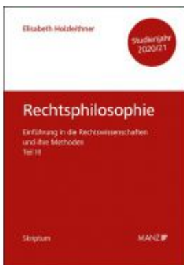
Rechtsphilosophie und Rechtsethik Einführung in die Rechtswissenschaften und ihre Methoden: Teil III Ladenpreis: 14,00 EUR