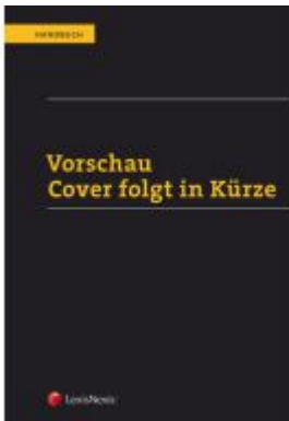
Handbuch Rechnungslegung / Handbuch Rechnungslegung, Band III: Die Abschlussprüfung Ladenpreis: 110,00 EUR