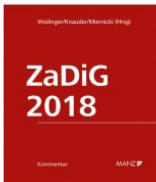
Kommentar zum Zahlungsdienstegesetz ZaDiG 2018 Aktionspreis: 198,00 EUR Ladenpreis: 239,00 EUR