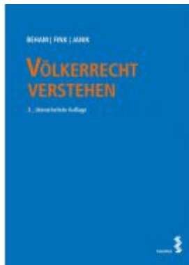
Völkerrecht verstehen Ladenpreis: 34,00 EUR