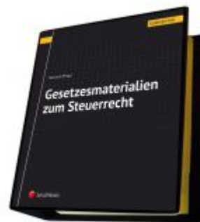
Gesetzesmaterialien zum Steuerrecht Ladenpreis: 160,00 EUR