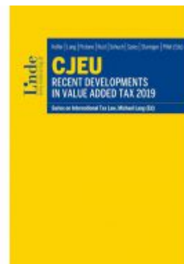
CJEU - Recent Developments in Value Added Tax 2019 Ladenpreis: 88,00 EUR