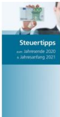
Steuertipps zum Jahresende 2020 & Jahresanfang 2021 Ladenpreis: 12,00 EUR

Wir haben andere Produkte gefunden, die Ihnen gefallen könnten!