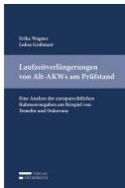
Laufzeitverlängerungen von Alt-AKW am Prüfstand Ladenpreis: 45,00 EUR