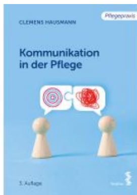
Kommunikation in der Pflege Ladenpreis: 19,90EUR