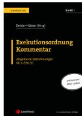
Exekutionsordnung Kommentar - Band I Ladenpreis: 196,00EUR