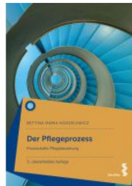
Der Pflegeprozess Ladenpreis: 24,90EUR