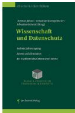
Wissenschaft und Datenschutz Ladenpreis: 55,00EUR