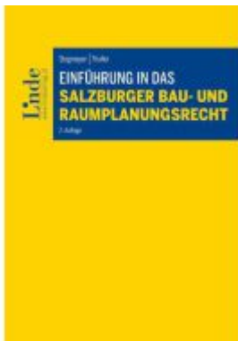
Einführung in das Salzburger Bau- und Raumplanungsrecht Ladenpreis: 56,00EUR

Wir haben andere Produkte gefunden, die Ihnen gefallen könnten!