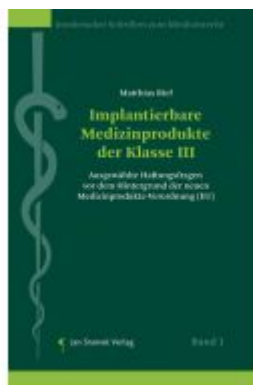
Implantierbare Medizinprodukte der Klasse III Ladenpreis: 68,00EUR