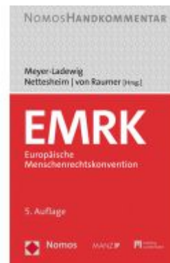
EMRK - Europäische Menschenrechtskonvention Ladenpreis: 142,90EUR