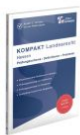
KOMPAKT Landesrecht - Hessen Ladenpreis: 22,60EUR