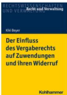
Der Einfluss des Vergaberechts auf Zuwendungen und ihren Widerruf