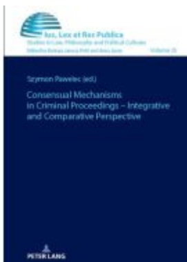
Consensual Mechanisms in Criminal Proceedings – Integrative and Comparative Perspective