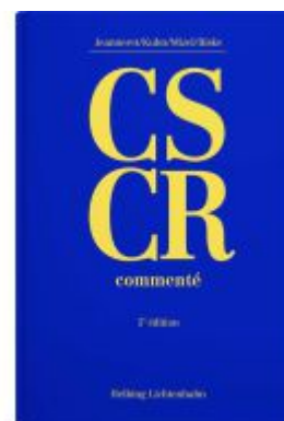
Code suisse de la circulation routière commenté (CS CR)