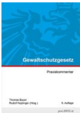
Gewaltschutzgesetz Ladenpreis: 33,00EUR