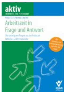
Arbeitszeit in Frage und Antwort