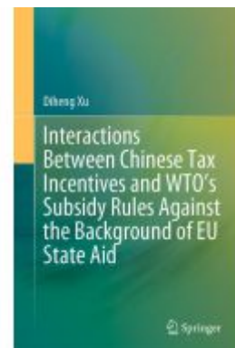
Interactions Between Chinese Tax Incentives and WTO's Subsidy Rules Against the Background of EU State Aid Ladenpreis: 164,99EUR