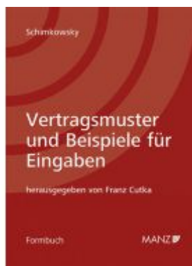
Vertragsmuster und Beispiele für Eingaben 9. Auflage Ladenpreis: 398,00 EUR