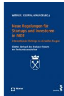
Neue Regelungen für Startups und Investoren in MOE Ladenpreis: 38,00 EUR