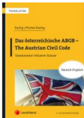
Das österreichische ABGB - The Austrian Civil Code Ladenpreis: 79,00 EUR