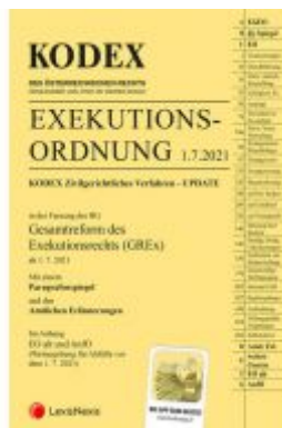
Kodex Exekutionsordnung - GREx - inkl. App Ladenpreis: 22,00 EUR