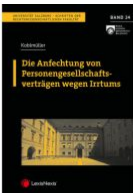
Die Anfechtung von Personengesellschaftsverträgen wegen Irrtums Ladenpreis: 32,00 EUR