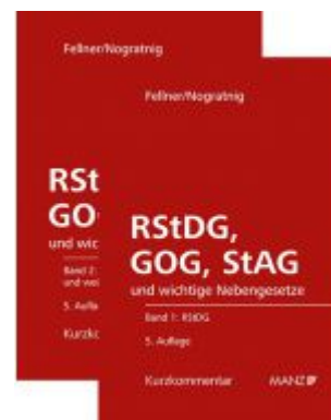
RStDG, GOG und StAG Richter- und StaatsanwaltschaftsdienstG, GerichtsorganisationsG und StaatsanwaltschaftsG Ladenpreis: 298,00 EUR