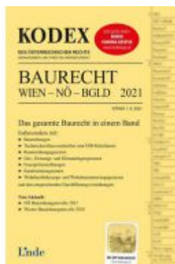
KODEX Baurecht Wien - NÖ - Bgld 2021 Ladenpreis: 65,00 EUR