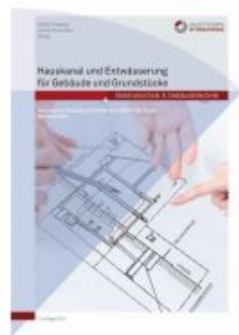
Hauskanal und Entwässerung für Gebäude und Grundstücke