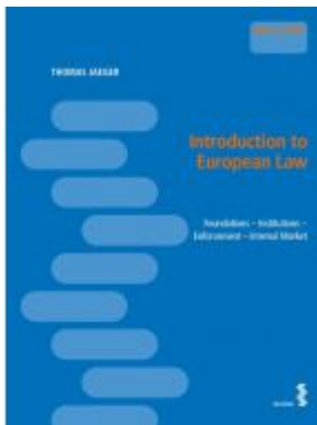
Introduction to European Law Ladenpreis: 22,00 EUR