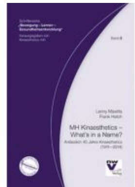
MH Kinaesthetics - What's in a Name? Ladenpreis: 26,80 EUR