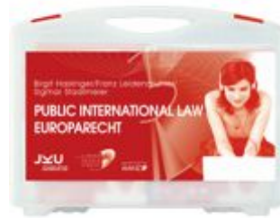
Medienkoffer Public International Law / Europarecht Ladenpreis: 283,80 EUR