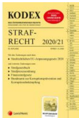
KODEX Strafrecht 2020/21 Ladenpreis: 36,00 EUR