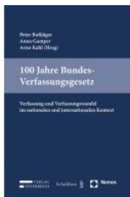
100 Jahre Bundes-Verfassungsgesetz