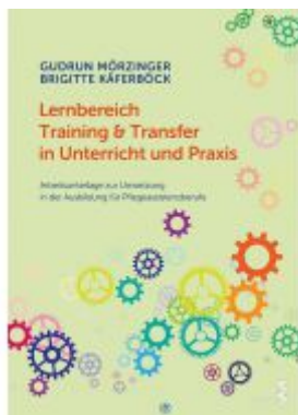
Lernbereich Training & Transfer in Unterricht und Praxis