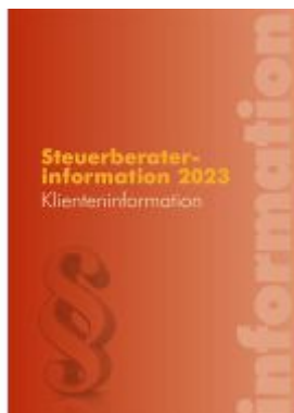
Steuerberaterinformation 2023 Ladenpreis: 49,50EUR