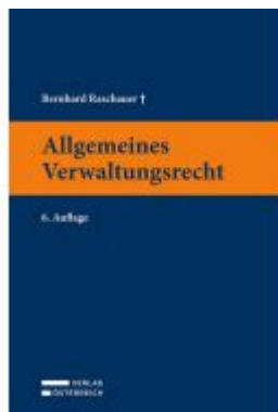
Allgemeines Verwaltungsrecht Ladenpreis: 49,00EUR

Wir haben andere Produkte gefunden, die Ihnen gefallen könnten!