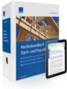
Rechtshandbuch Dach- und Fassadenbau Ladenpreis: 239,80EUR