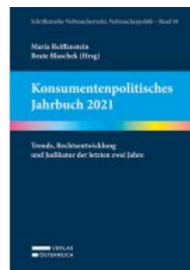
Konsumentenpolitisches Jahrbuch 2021 Ladenpreis: 89,00EUR