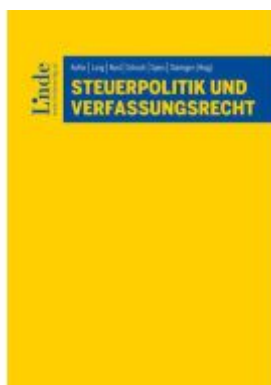
Steuerpolitik und Verfassungsrecht Ladenpreis: 75,00EUR