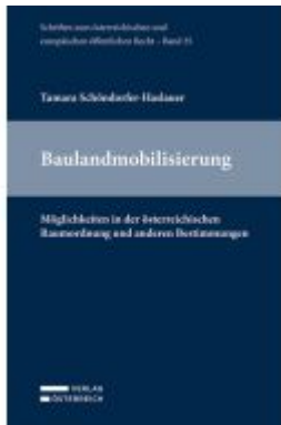
Baulandmobilisierung Ladenpreis: 64,00EUR