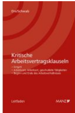
Kritische Arbeitsvertragsklauseln Ladenpreis: 138,00EUR