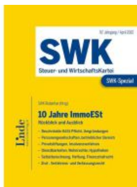
SWK-Spezial 10 Jahre ImmoEST Ladenpreis: 39,00EUR