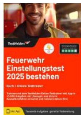
Feuerwehr Einstellungstest 2025 bestehen: Buch + Online Testtrainer Trainiere mit dem TestHelden Online-Testtrainer inkl. App in +5.000 Aufgaben mit Lösungen, was dich im Auswahlverfahren erwartet und meistere deinen Test Ladenpreis: 41,10EUR