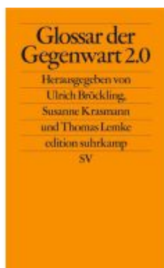
Glossar der Gegenwart 2.0 Ladenpreis: 24,70EUR