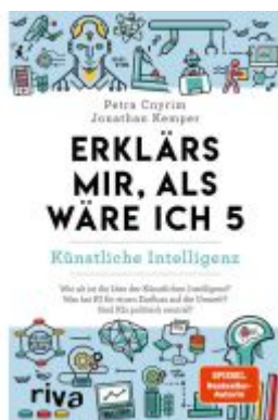
Erklär mir, als wäre ich 5 – Künstliche Intelligenz Ladenpreis: 10,30EUR