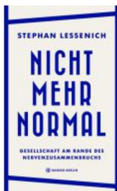
Nicht mehr normal Ladenpreis: 23,70EUR