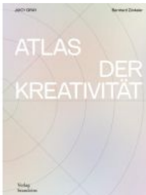
Atlas der Kreativität Ladenpreis: 49,00EUR

Wir haben andere Produkte gefunden, die Ihnen gefallen könnten!