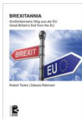
BREXITANNIA Ladenpreis: 20,40EUR