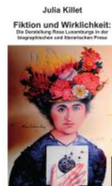
Fiktion und Wirklichkeit Ladenpreis: 32,90EUR