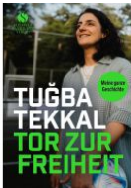
Tor zur Freiheit Ladenpreis: 22,70EUR