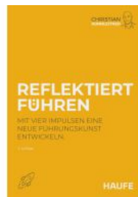
Reflektiert führen Ladenpreis: 41,20EUR