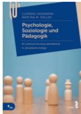
Psychologie, Soziologie und Pädagogik Ladenpreis: 28,90EUR