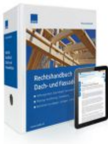
Rechtshandbuch Dach- und Fassadenbau Ladenpreis: 239,80EUR