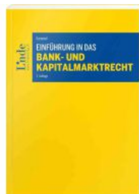
Einführung in das Bank- und Kapitalmarktrecht Ladenpreis: 62,00EUR