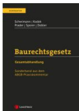
Baurechtsgesetz Ladenpreis: 82,00EUR