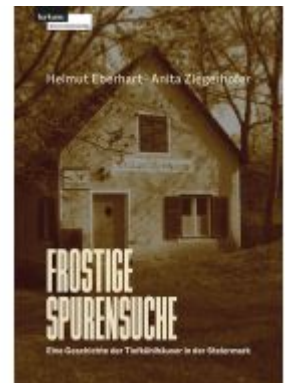
Frostige Spurensuche – Eine Geschichte der Tiefkühlhäuser in der Steiermark Ladenpreis: 30,50EUR