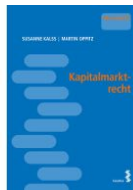
Kapitalmarkt-recht Ladenpreis: 16,00EUR