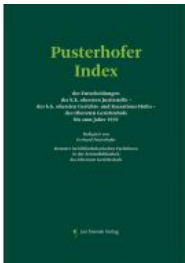
Pusterhofer Index Ladenpreis: 198,00EUR

Wir haben andere Produkte gefunden, die Ihnen gefallen könnten!