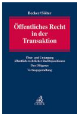
Öffentliches Recht in der Transaktion Ladenpreis: 204,60EUR

Wir haben andere Produkte gefunden, die Ihnen gefallen könnten!