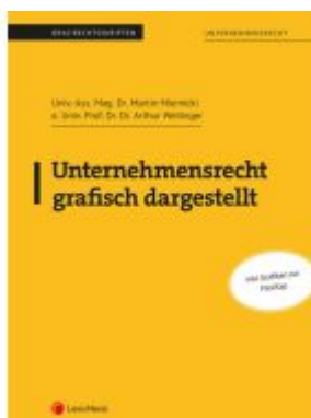
Unternehmensrecht grafisch dargestellt Ladenpreis: 31,00EUR