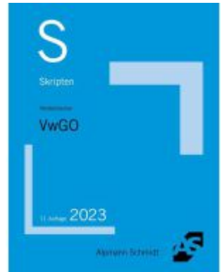
Skript VwGO Ladenpreis: 23,60EUR