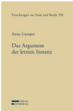
Das Argument der letzten Instanz Ladenpreis: 110,00EUR