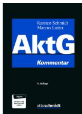
Aktiengesetz Ladenpreis: 410,20EUR