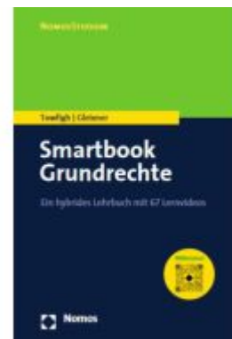
Smartbook Grundrechte Ladenpreis: 27,70EUR