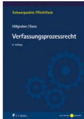
Verfassungsprozessrecht Ladenpreis: 28,80EUR