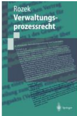
Verwaltungsprozessrecht Ladenpreis: 20,51EUR