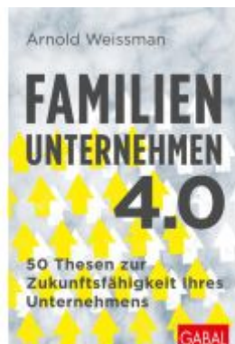
Familienunternehmen 4.0 Ladenpreis: 30,80EUR