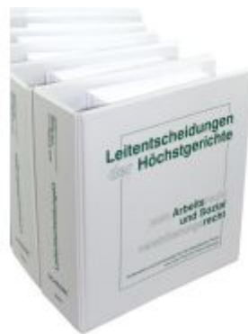
Leitentscheidungen der Höchstgerichte zum Arbeitsrecht und Sozialversicherungsrecht Ladenpreis: 1.360,00EUR