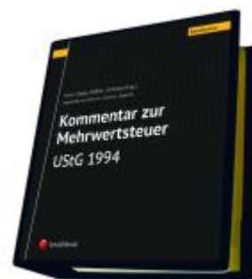
Kommentar zur Mehrwertsteuer - UStG 1994 Ladenpreis: 825,00EUR