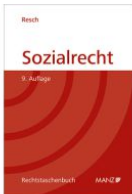
Sozialrecht Ladenpreis: 39,20EUR

Wir haben andere Produkte gefunden, die Ihnen gefallen könnten!