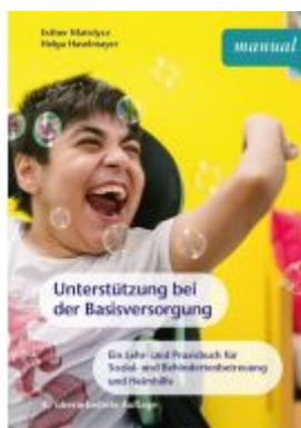
Unterstützung bei der Basisversorgung Ladenpreis: 26,90EUR