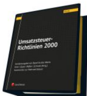
Umsatzsteuer-Richtlinien 2000 Ladenpreis: 174,00EUR