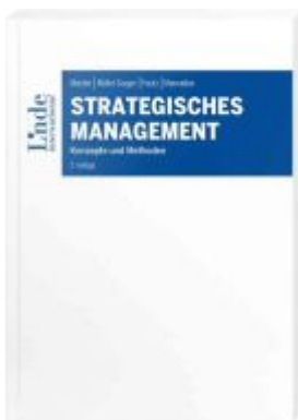
Strategisches Management Ladenpreis: 40,00EUR