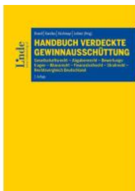
Handbuch Verdeckte Gewinnausschüttung Ladenpreis: 98,00EUR