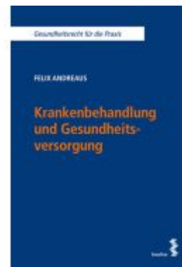
Krankenbehandlung und Gesundheitsversorgung Ladenpreis: 32,00EUR