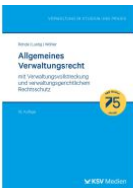
Allgemeines Verwaltungsrecht Ladenpreis: 36,00EUR