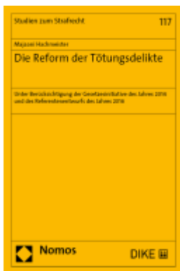
Die Reform der Tötungsdelikte Ladenpreis: 109,00EUR