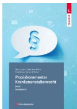
Praxiskommentar Krankenanstaltenrecht Ladenpreis: 442,00EUR