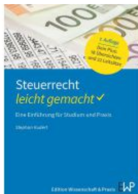
Steuerrecht – leicht gemacht Ladenpreis: 16,40EUR