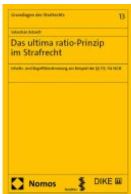
Das ultima ratio-Prinzip im Strafrecht Ladenpreis: 112,10EUR

Wir haben andere Produkte gefunden, die Ihnen gefallen könnten!