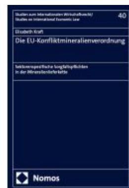
Die EU-Konfliktmineralienverordnung Ladenpreis: 112,10EUR