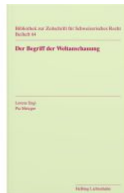
Der Begriff der Weltanschauung Ladenpreis: 42,00EUR