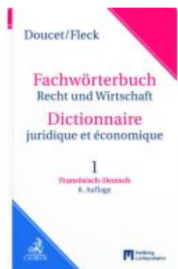
Wörterbuch Recht- und Wirtschaft Dictionnaire juridique et économique, Teil I: Französisch-Deutsch Ladenpreis: 109,00EUR