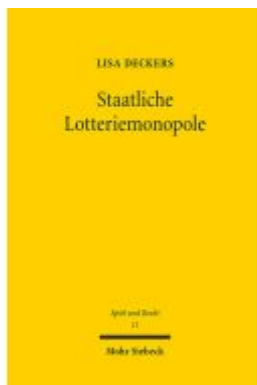
Staatliche Lotteriemonopole Ladenpreis: 91,50EUR